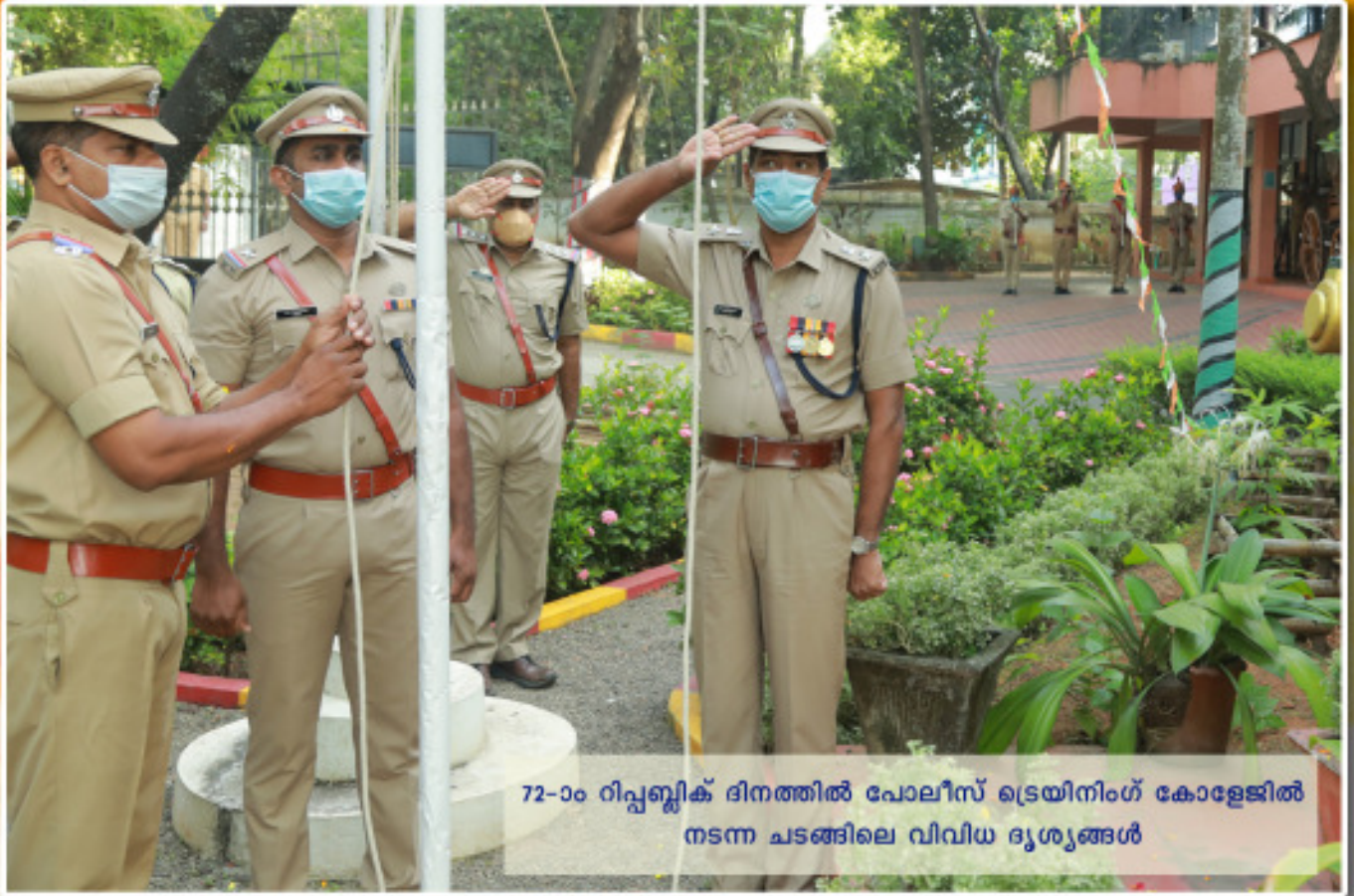
72-ാം റിപ്പബ്ലിക് ദിനത്തിൽ പോലീസ് ട്രെയിനിംഗ് കോളേജിൽ നടന്ന ചടങ്ങിലെ വിവിധ ദൃശ്യങ്ങൾ